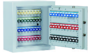
Art.-Nr. 14000 (Lieferung o. Anh.)

B nach VDMA 24992 Ausg. Mai 95 und S2 EN 14450