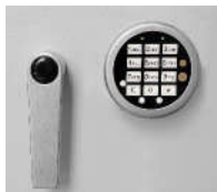
Art.-Nr. 44721 und Art.-Nr. 44722

Der Einbau von EMA-Komponenten (doppelte Versicherungssumme) ist gegen Aufpreis möglich (Sprechen Sie hierzu mit Ihrer Versicherung).